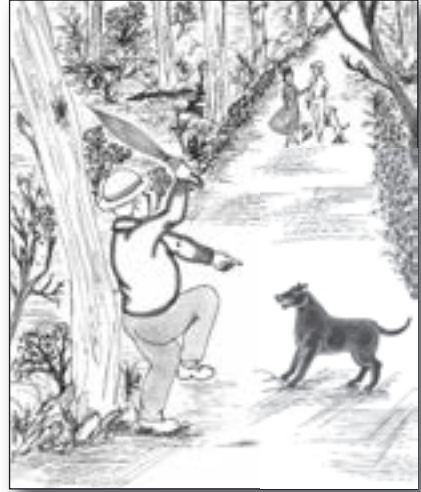
Zeichnerin: Roxana Khazdoezian

Ävver su ne Eijensenn jitt et en der Technik och: Ming Ohr zom Exempel, die jeit och bloß, wann sei well. Un mi Förzüg zeig nor e Flämmche, wann et im jefällt. Un de Jlöhlampe brenne durch, wann et meer am winnigste zo pass kütt. Also: För mich veräppele zo loße, bruchen ich doch keine Zemmeradler. Am Engk jitt et üvverhaup keine Jrund, för sich ene Vogel en de Bud zo holle. Hä jitt kein Milch un keine Hunnig, mer kann nit met im spazeere jon, hä pass