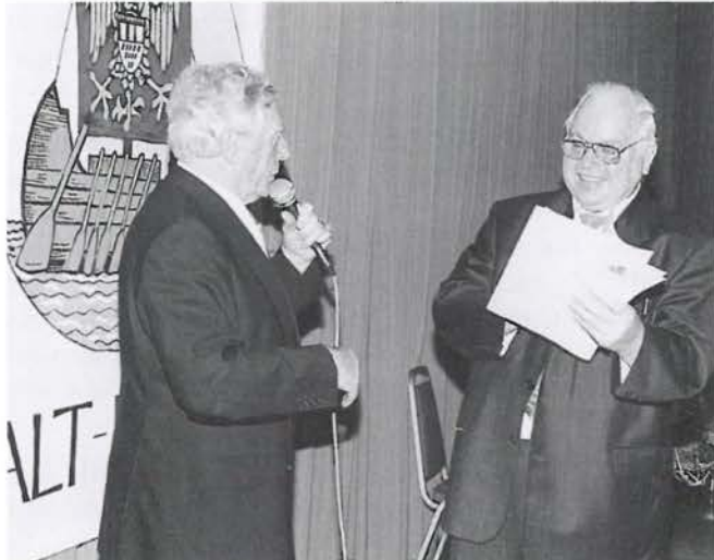
Der Vorsitzende strahlend nach der Entgegennahme des Widmungsexemplars von »Mer fläge kölsche Eigenaat«

auch etwas Heiteres drin vorkommen?« Ich habe damals geantwortet: »Ich bitte darum. Wä soll uns dann