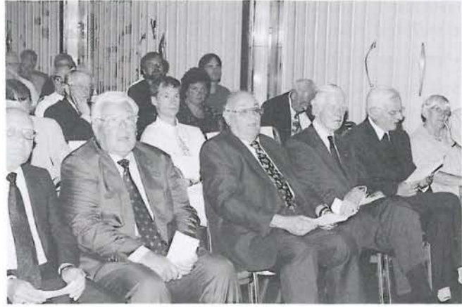
Wä sitz dann do allt widder en der eeschte Reih?