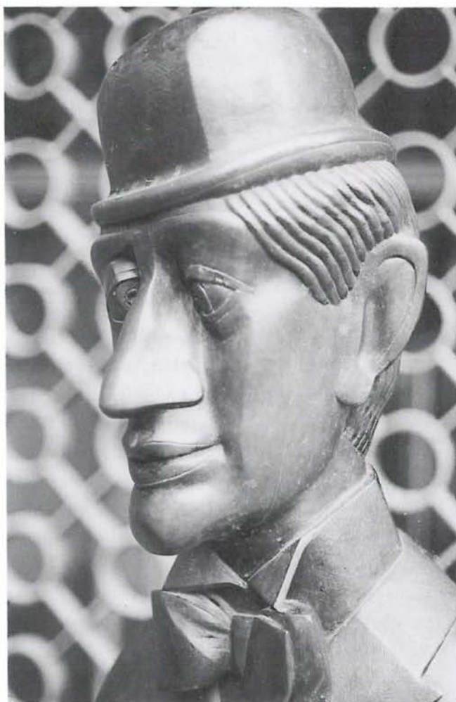
Gesucht und gefunden: Zwei Bekannte