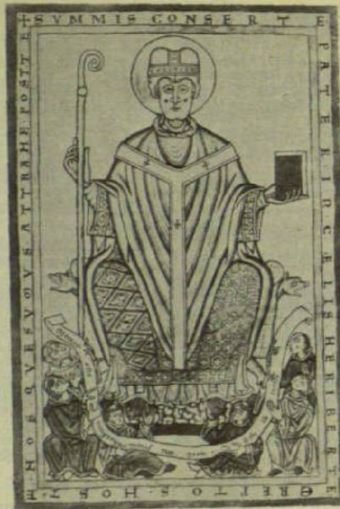
Erzbischof Heribert, aus einem Deutzer Codex.

Für das 12. und 13. Jahrhundert lassen sich verschiedene Bauveränderun-