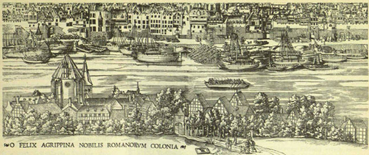
Deutz mit der Abtei St. Heribert im Vordergrund des Holzschnittes von Woensam von Worms aus dem Jahre 1551.