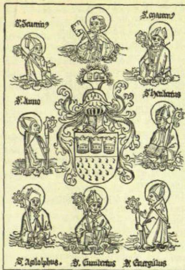
Santa Colonia dicitur, quia sanguine tincta Sancorum, meritis quoque istas undiq; tincta

Das hohe Lob, das Niebuhr, ein bedeutender Historiker des 19. Jahrhunderts, der Koelhoff'schen Chronik zollt, findet der Leser bei eingehender Beschäftigung mit dem kostbaren Werk bestätigt. Man hat die „ganz vortreffliche alte Cöllner Chronik theilweise zu unseren classischen Werken zu rechnen,