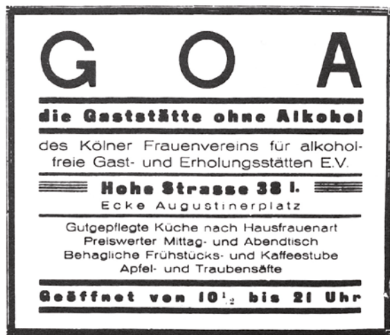
Anzeige für GOA (Gaststätte ohne Alkohol), Köln 1929