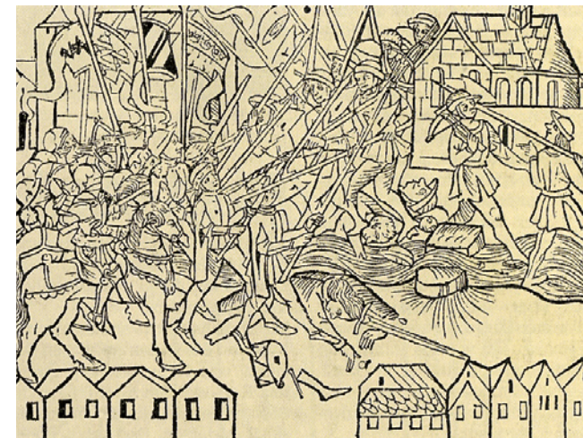
Die Kölner Weberschlacht von 1371, Holzschnitt aus der Koehlhoffschen Chronik von 1499.